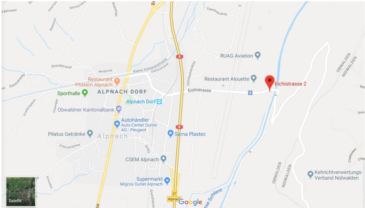
ARA Sarneraatal, Alpnach